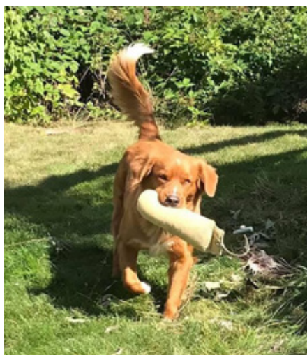
SE VCH Westcoasttollers Coco "Coco"