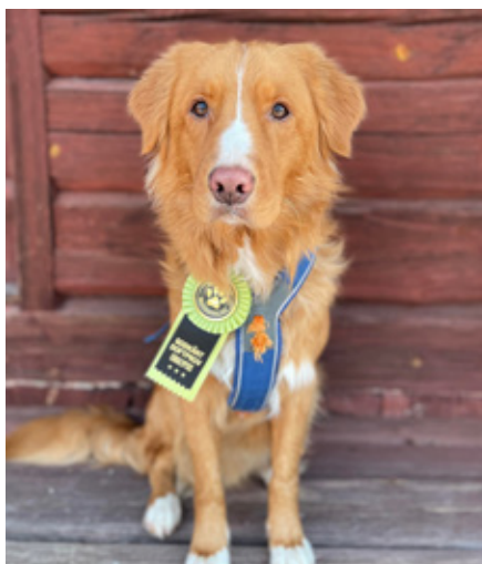
SE VCH RLD N BIZZNESS ASTERIX "Asterix"