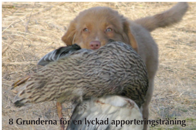
8 Grunderna för en lyckad apporteringsträning