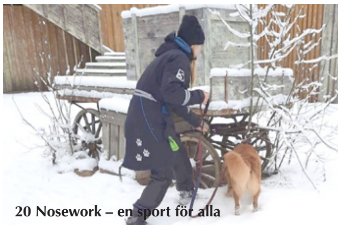
20 Nosework – en sport för alla