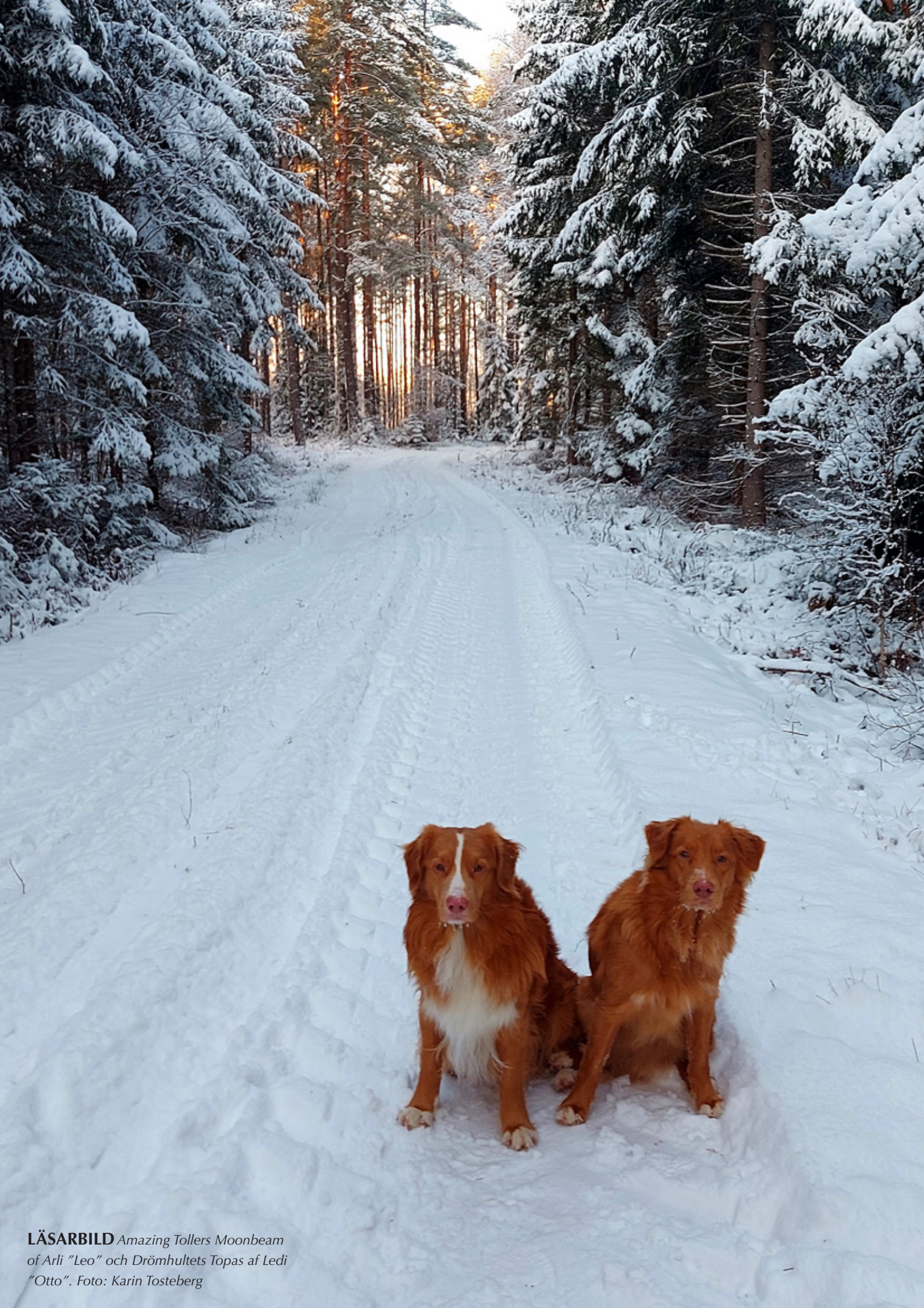
LÄSARBILD Amazing Tollers Moonbeam of Arli "Leo" och Drömhultets Topas af Ledi "Otto".