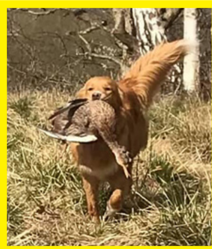
SE VCH Westcoasttollers Touch "Touch"