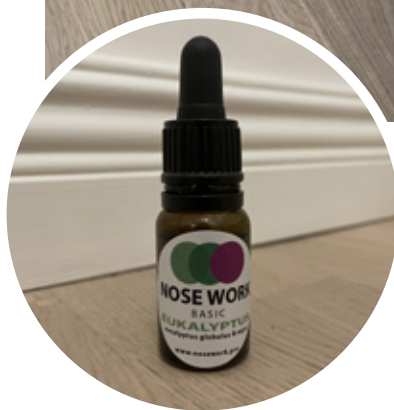
Ovan: Olika typer av behållare och doftbärare (tops+möbeltass). Cirkeln: Doft för NW1 eukalyptus.

“Är du en bit bort kan du använda ett belöningsord eller hurra lite för att tjäna lite tid så du hinner fram med godisen. ”