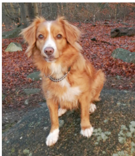
Blazing Flowers Honey Bee "Nåva"