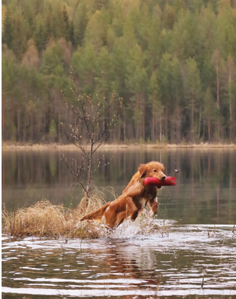
LÄSARBILD Pathseekers My Soulmate Viddjá.

Hundar ska numera vara 12 månader eller mer vid sin debut. Förändringar finns också t.ex. när det gäller de praktiska tollingjaktproven, och att de särskilda proven tagits bort.