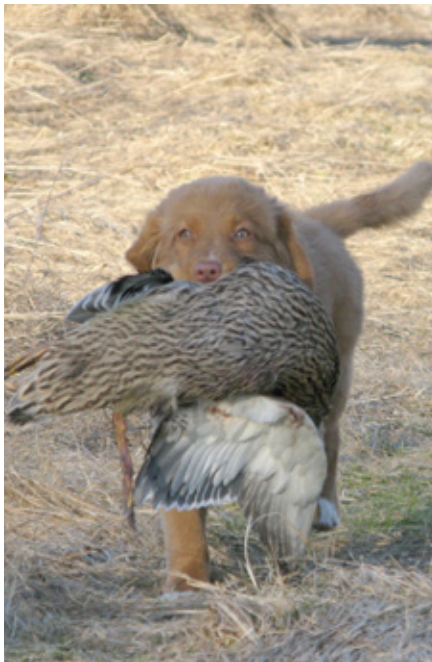
Speja valp med and.

Ett exempel på sådan övning är klockan. Om du har apportert utlagda klockan 12, 3, 6 och 9 och står vid mittpunkten och skickar hunden mot klockan 12 innebär det att hunden måste sortera bort de närmaste apporterna, det vill säga klockan 3 och 9. Om du ser till att alla fyra apporterna alltid ligger ute, innebär det att hunden varje gång måste "välja bort" tre av fyra för att ta den jag vill.