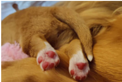
River Flames Rymdkull.

"Jag skulle vilja rikta ett stort tack till kennel Björnhedens för att jag fick möjlighet att ta mig an denna fina lilla tösen. Björnhedens Superdrifta "Drifta". Kan inte med ord beskriva min tacksamhet! Oss kommer ni se på lydnadsplanen, i skidspåret, i skogen och mark. Apportering och tolling är också något vi kommer syssla med! Min första tollare, nu rockar vi. Mor: Chroje Jippie Supernova Far: Njupavallens Valter"