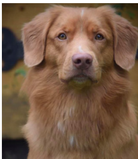
Westcoasttollers Sumo "Tilo"