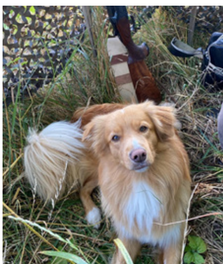
SE VCH Westcoasttollers Grand Perfektion "Dusty"