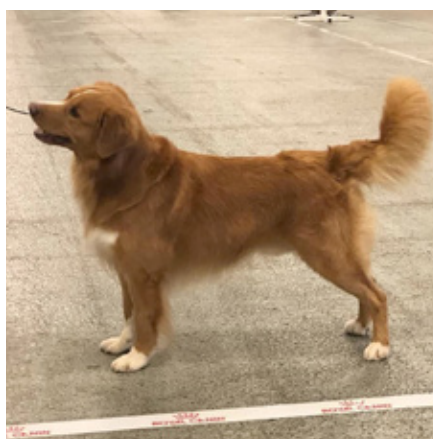
SE VCH RLD N RLD F LD STARTKLASS Westcoasttollers Bounty "Allwin"

Utställning 2019-06-16 SSRK Gränna CERT 2019-08-24 SKK Ljungkile CERT 2021-11-14 Winter Wonder show Herning Danmark 2 CERT 1 CACIB Kvalificerad till Crufts