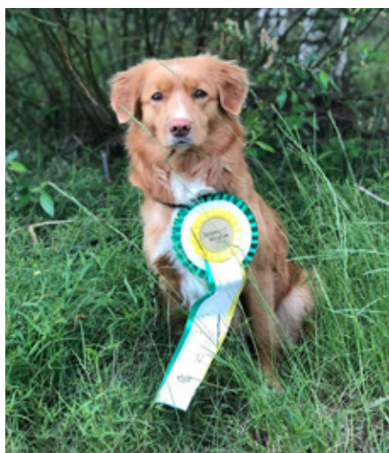
LD STARTKLASS RLD N RLD F SE VCH West Coast Tollers Cayuga "Trissie"